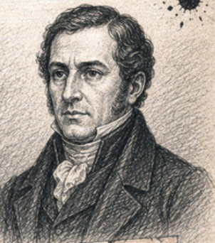
JUAN JOSÉ PASO ★ SECRETARIO

Abogado, periodista y político. Impulsó la libertad de prensa, la educación y la igualdad. Creía en un país más justo e ilustrado.