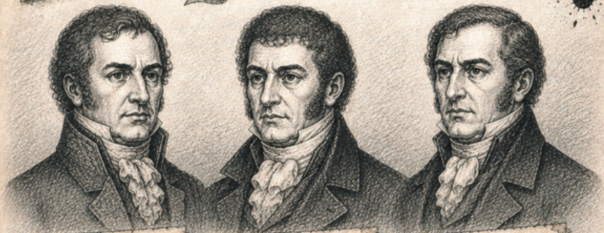
MANUEL ALBERTI ★ VOCAL

Comerciante y político. Apoyó la Revolución de Mayo y formó parte de la Primera Junta como representante del pueblo.