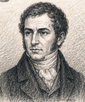
MARIANO MORENO ★ SECRETARIO

Militar y patriota. Fue elegido Presidente de la Primera Junta. Defendió la soberanía y la unidad del pueblo.