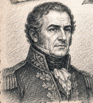
CORNELIO SAAVEDRA ★ PRESIDENTE

Militar y patriota. Fue elegido Presidente de la Primera Junta. Defendió la soberanía y la unidad del pueblo.